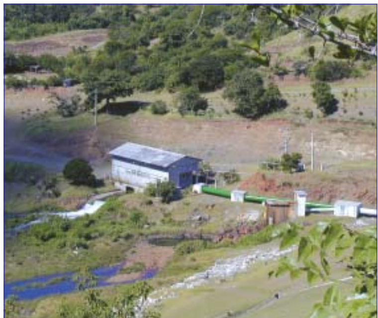
Fig. 1. PCH "Los Asientos", provincia Guantánamo.

Dentro de los propósitos de desarrollo de la hidroenergía en Cuba se encuentra el incremento de la generación de energía eléctrica por medio de pequeños aprovechamientos hidroenergéticos (PAH) ubicados a pie de presa. Como método para planificar el aprovechamiento de las aguas del embalse con dicho fin se ha utilizado el Balance Hidroeconómico del Embalse (BHE); éste permite llevar a parámetros energéticos el posible volumen de agua a suministrar a las turbinas hidráulicas del PAH, al seleccionarse como variable de control la carga del embalse, ya que ésta permite conocer la hiperanualidad en el almacenamiento de las aguas, garantizándose así la eficiencia con que deben trabajar los hidrogrupos en los PAH.